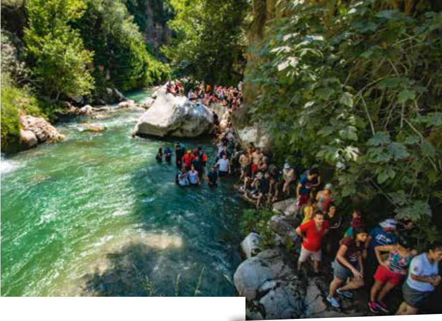
Adana il merkezine 68 kilometre uzaklıkta bulunan Krkn Kanyonu, bunaltıcı yaz sıcaklarından ve şehrin stresinden bunalan doęaseverlerin akınına uğruyor.