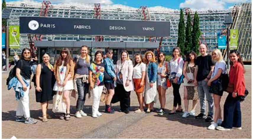
Dokuma kumaşın değerini ortaya koyan genç tasarımcılar Paris Premiere Vision Manufacturing Fuarı'nda moda trendlerinin nabzını tuttu, yeni deneyimler kazandı.